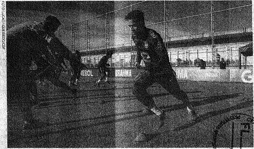
... pós a mais convincente... no tiro livre de Gabriel Jesus Seleção Brasileira encara

A partir das 21h30, a bola vai rolar para Brasil x Paraguai. Em campo, o tabu de ter sido eliminado duas vezes seguidas pelo adversário, além da preocupação com o gramado