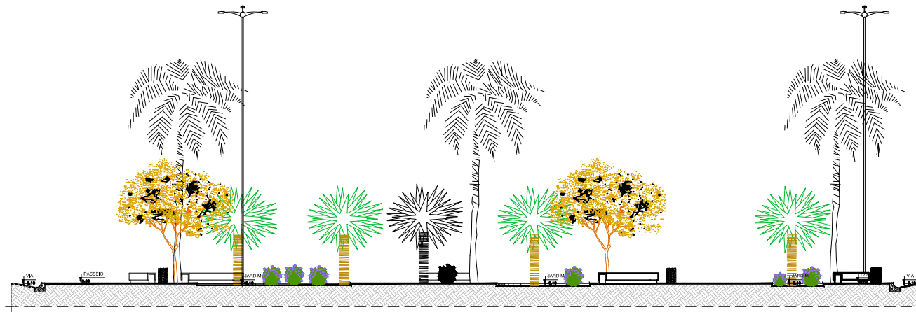
1 CORTE AA ESCALA 1/75