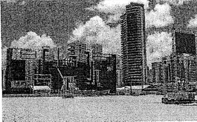
PALCO está sendo montado

Em anos anteriores, os fogos foram disparados de balsas localizadas no mar e do espigão da rua João Cordeiro. Neste ano, a prefeitura afirma em nota que não haverá "disparos de balsas ou outros mecanismos semelhantes". Mesmo assim, todos os espigões serão interditados durante a festa.