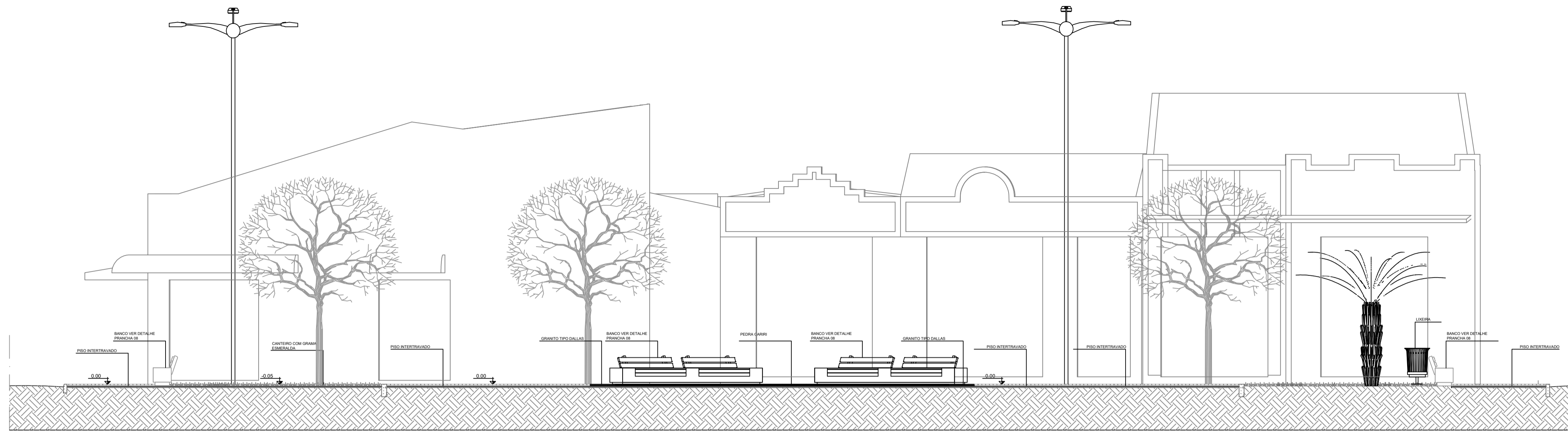
1 CORTE AA PRAÇA ESCALA 1/50