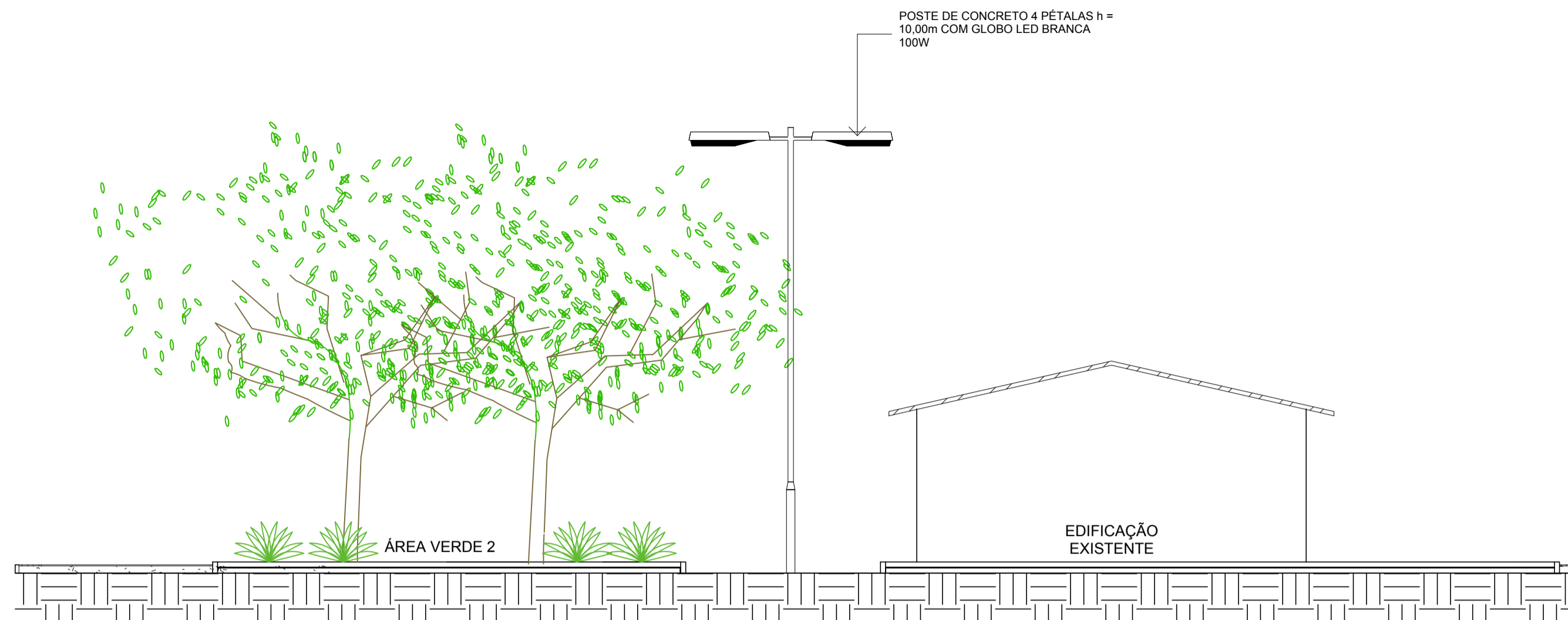
1 CORTE A ESCALA 1:75