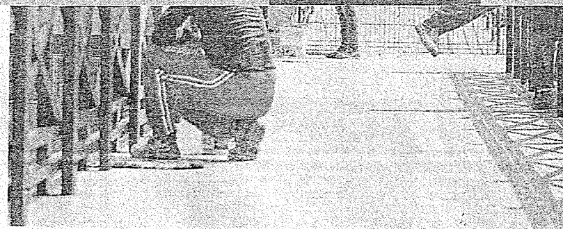
OBRAS do Polo Gastronômico da Sabiaguaba devem terminar este ano

"Como não tivemos o estudo arqueológico, não sabemos se o local tinha ou não um sí-