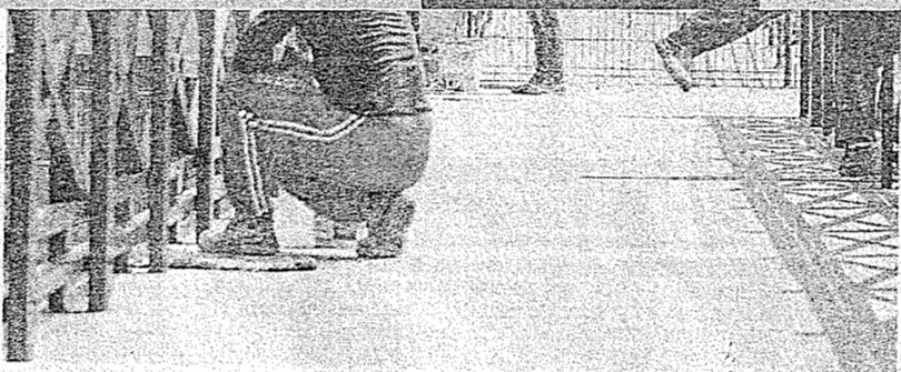
OBRAS do Polo Gastronômico da Sabiaguaba devem terminar este ano

"Como não tivemos o estudo arqueológico, não sabemos se o local tinha ou não um sí-