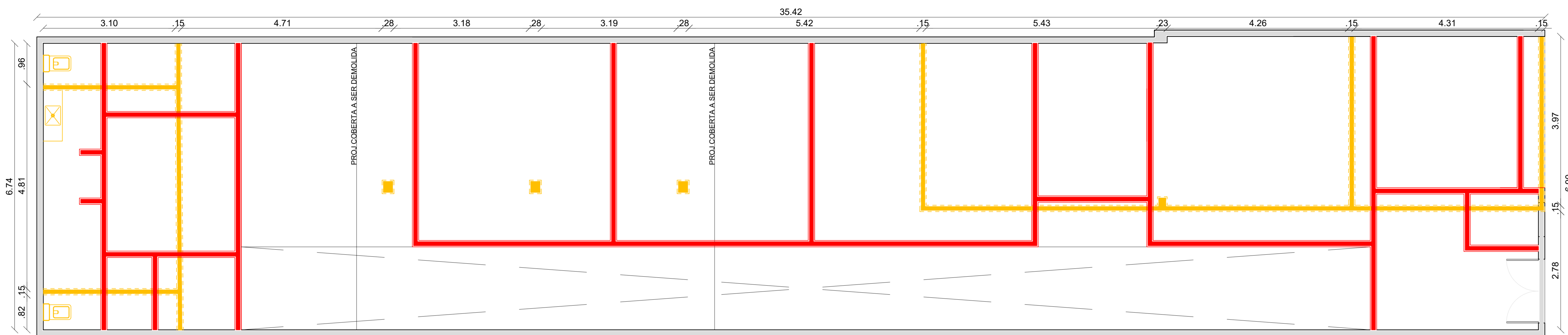
1 PLANTA CONSTRUIR/DEMOLIR ESCALA 1/50