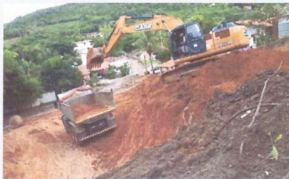
Caminhão Basculante, escavadeira hidráulica.