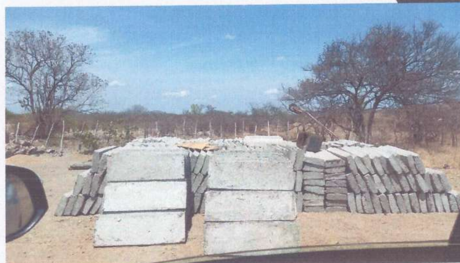
• Meio-fio premoldado.