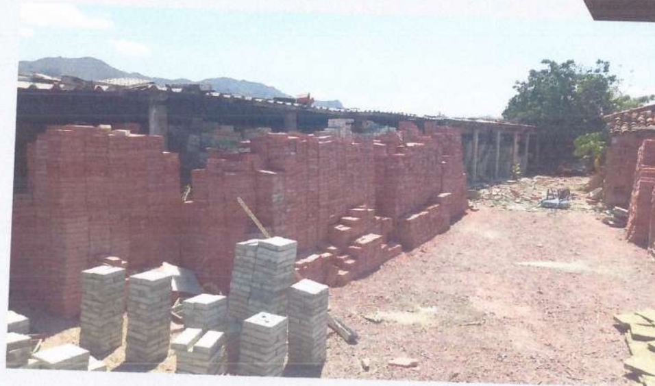
• Blocos de concreto H4 vidrado pigmentado.