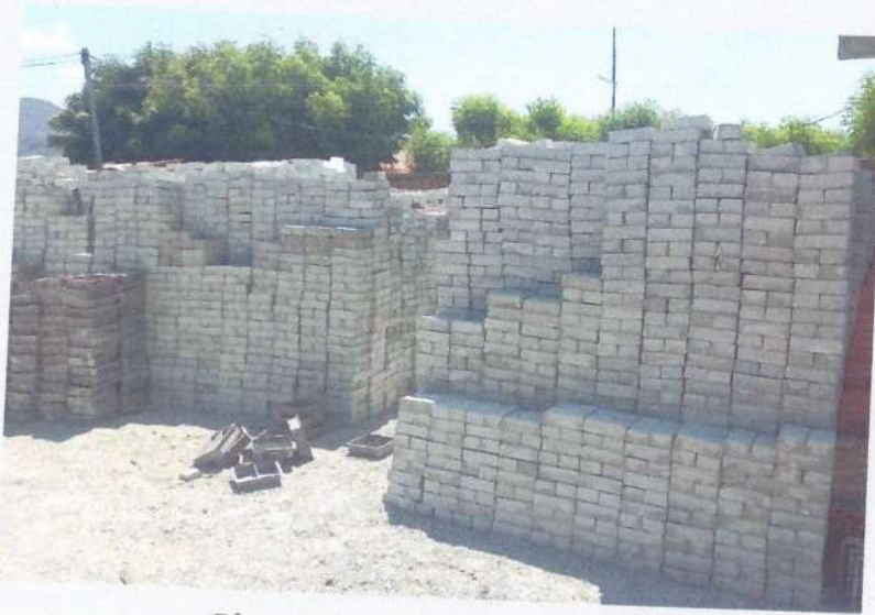
• Blocos de concreto H4 vidrado.