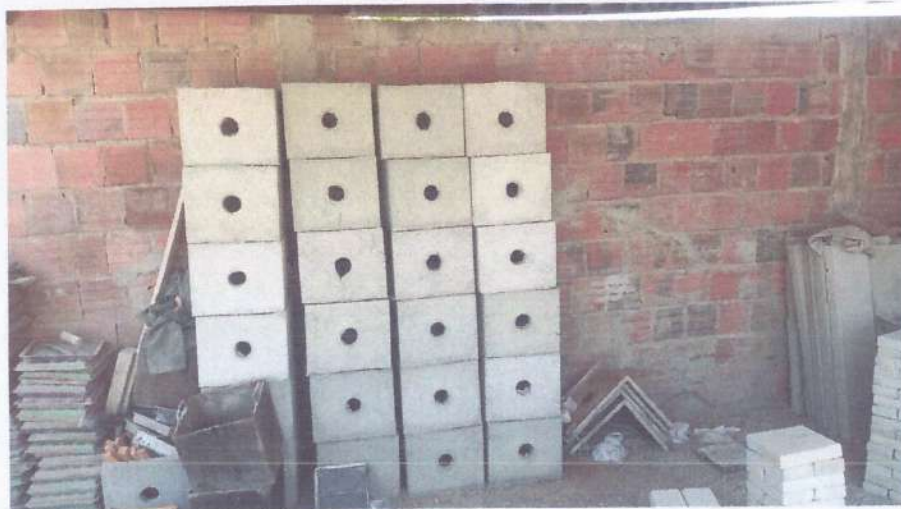
• Caixas premoldadas.