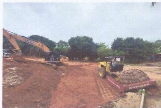
Compactador Pé de Carneiro