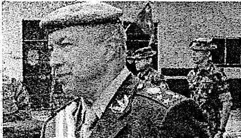
GENERAL Júlio Cesar Arruda, comandante do Exército exonerado