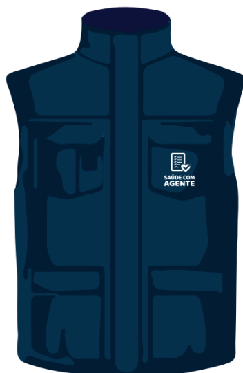
parte da frente