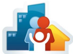
AGENTE COMUNITÁRIO DE SAÚDE