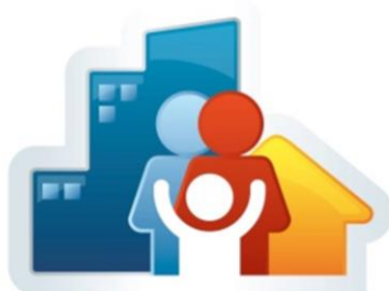
AGENTE COMUNITÁRIO DE SAÚDE