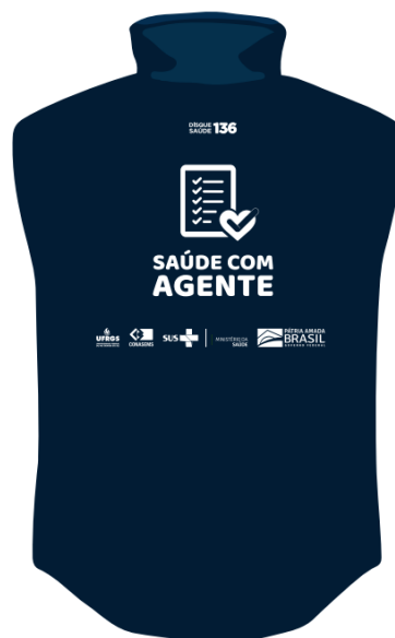
parte de trás