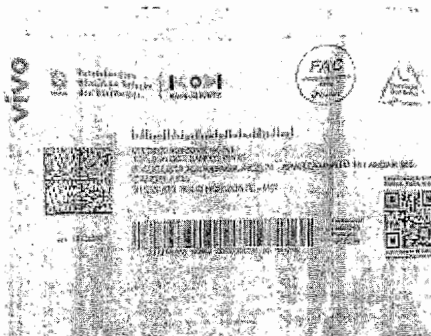
comprovante de residencia.jpeg 411K