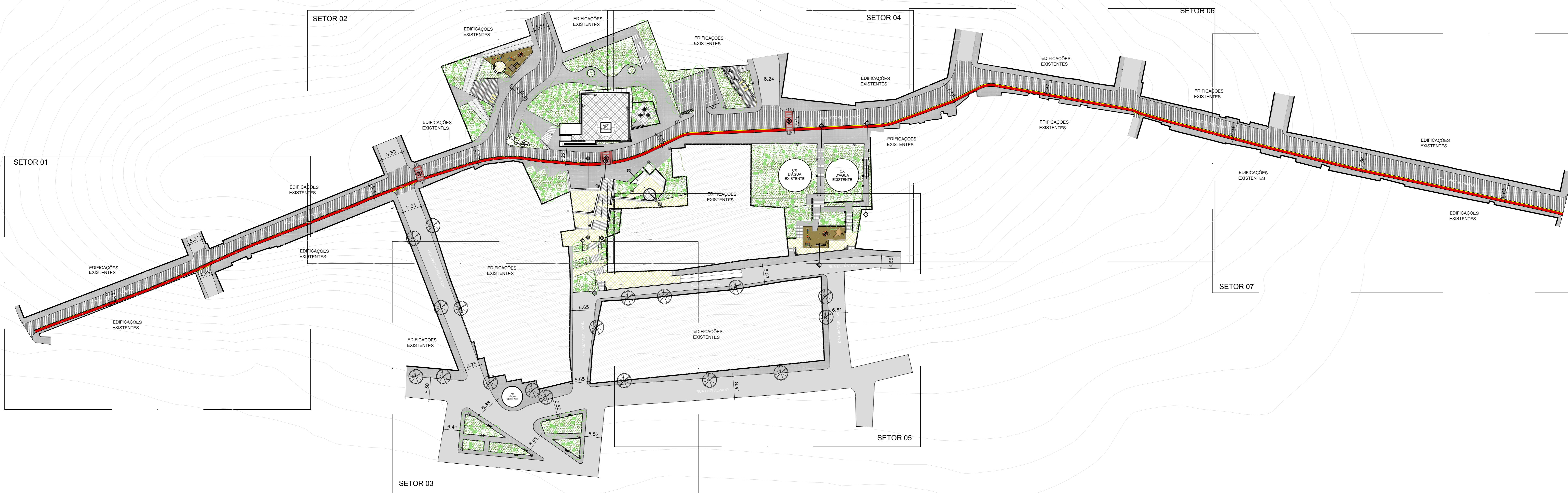
01 PLANTA - GERAL 1:600