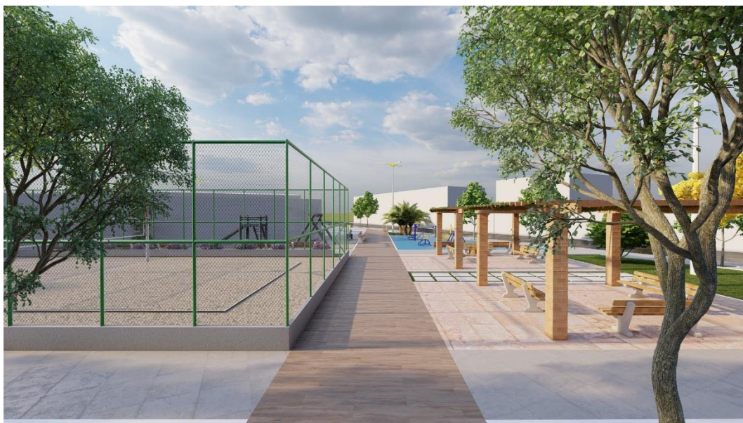
Fig.3 e Fig.4: Perspectiva eletrônica 01 e 02, respectivamente