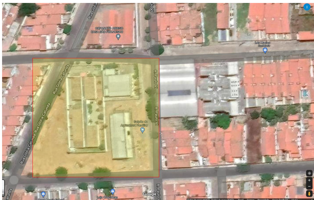
Fig.1: Localização Praça

A área em questão está localizada no bairro Domingos Olímpio, na cidade de Sobral-CE. Delimitada pela Rua Glória Catunda e Rua Eduardo de Almeida Stanford, as condições atuais de infraestrutura do local não permitem o pleno aproveitamento do seu potencial urbano e paisagístico, além de contar com espaços subutilizados e mal aproveitados.