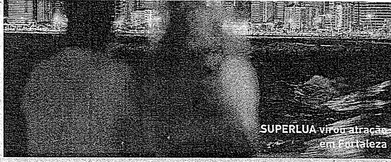
SUPERLUA virou atração em Fortaleza