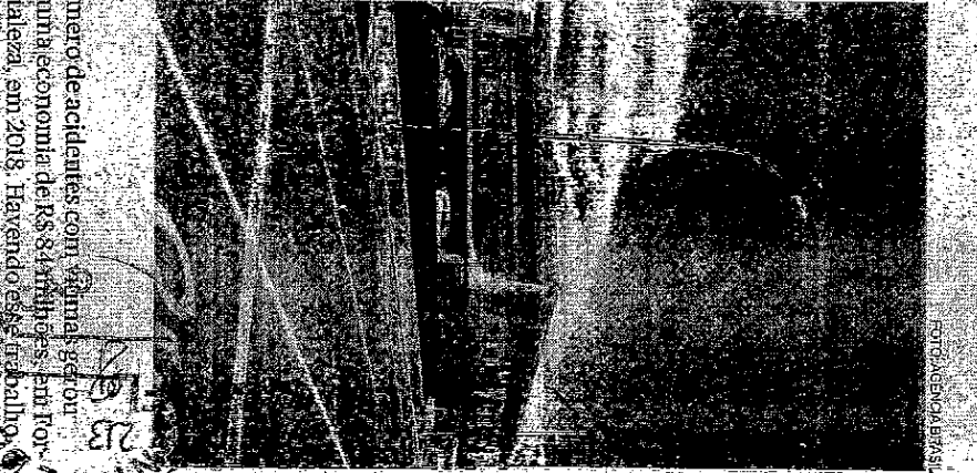
mero de acidentes com sinas gel ou uma economia de R$ 84 milhões. Em 17 de maio, em 2018. Havendo esse rebaixa-