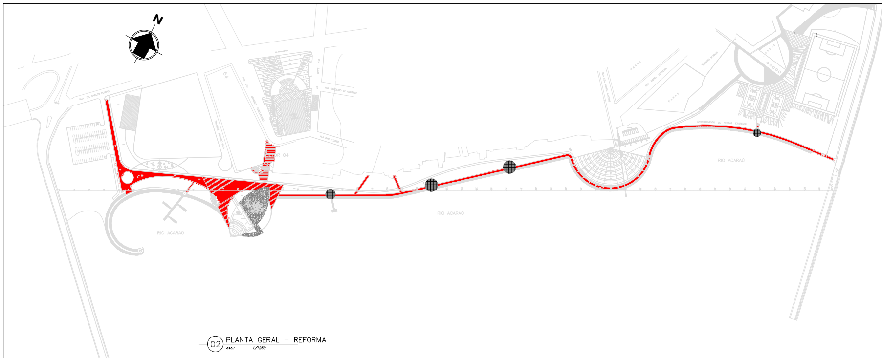
02 PLANTA GERAL – REFORMA esc.: 1/1250