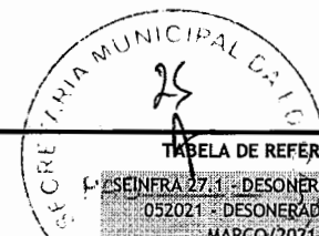
TABELA DE REFERÊNCIA:

SEINFRA 27.1 - DESONERADA / SINAPI 052021 - DESONERADA / ORSE MARÇO/2021-1