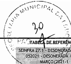
TABELA DE REFERÊNCIA:

SEINFRA 27.1 - DESONERADA / SINAPI 052021 - DESONERADA / ORSE MARÇO/2021-1