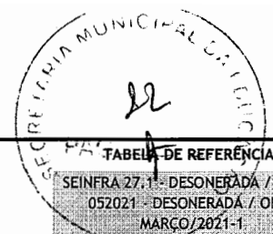
TABELA DE REFERÊNCIA:

SEINFRA 27-1 - DESONERADA / SINAPI 052021 - DESONERADA / ORSE MARÇO/2021-1