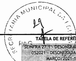
TABELA DE REFERÊNCIA:

SEINFRA 27.1 - DESONERADA / SINAPI 052021 - DESONERADA / ORSE MARÇO/2021-1