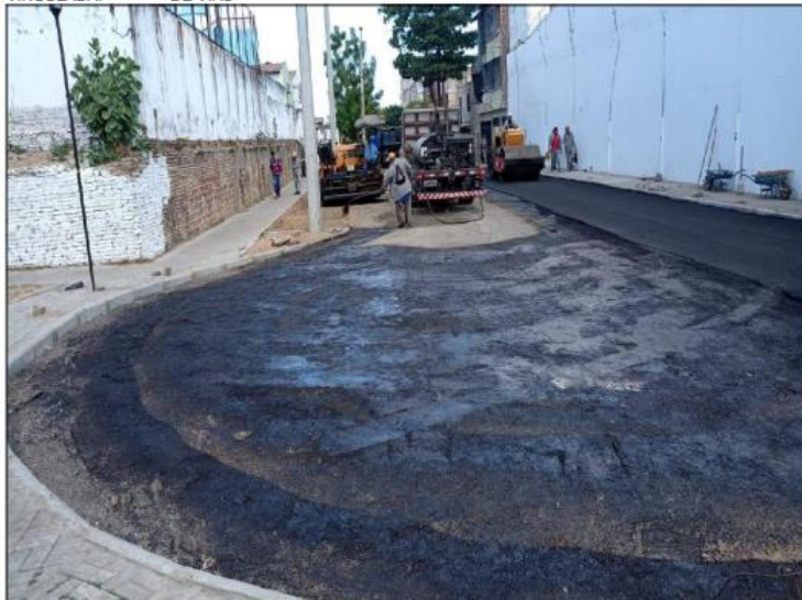
CAMINHÃO ESPARGIDOR - PINTURA DE LIGAÇÃO

CONTA VINCULADA: 1 - LOCAÇÃO DE EQUIPAMENTOS PARA A COORDENAÇÃO DE MANUTENÇÃO DE VIAS