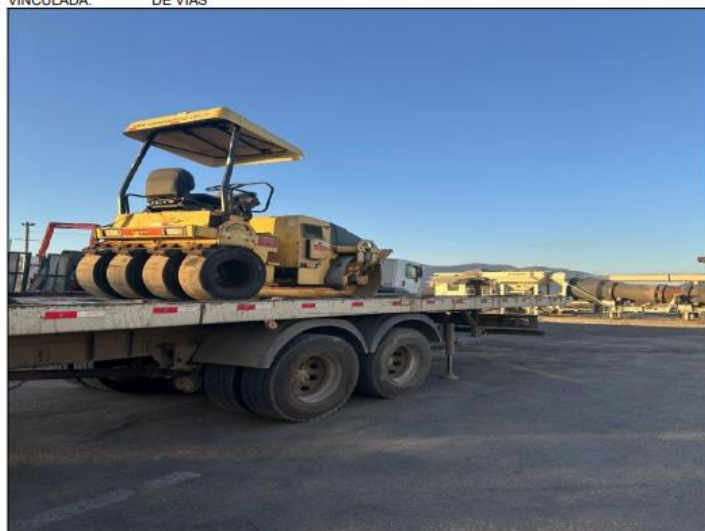
PLATAFORMA - TRANSPORTE DE EQUIPAMENTOS

CONTA VINCULADA: 1 - LOCAÇÃO DE EQUIPAMENTOS PARA A COORDENAÇÃO DE MANUTENÇÃO DE VIAS