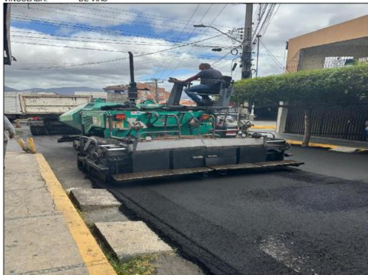
VIBROACABADORA - APLICAÇÃO DE CBUQ

CONTA VINCULADA: 1 - LOCAÇÃO DE EQUIPAMENTOS PARA A COORDENAÇÃO DE MANUTENÇÃO DE VIAS