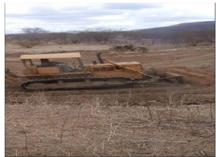
TRATOR DE ESTEIRA