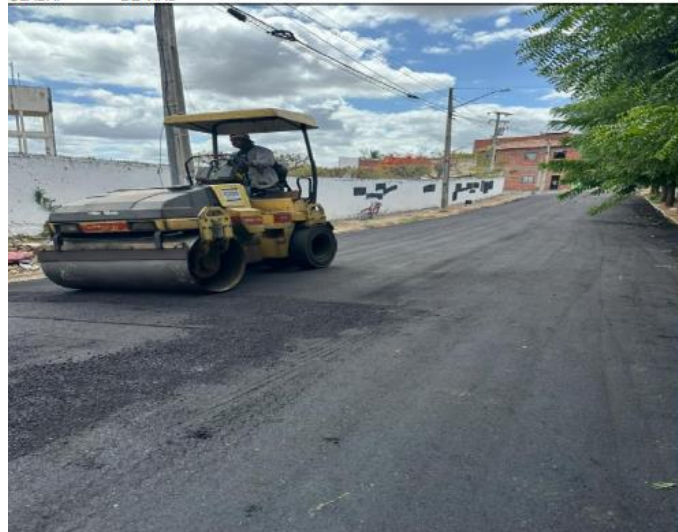
PACTAÇÃO DE CBUQ - ROLO TANDEM

TA ULADA: 1 - LOCAÇÃO DE EQUIPAMENTOS PARA A COORDENAÇÃO DE MANUTENÇÃO DE VIAS