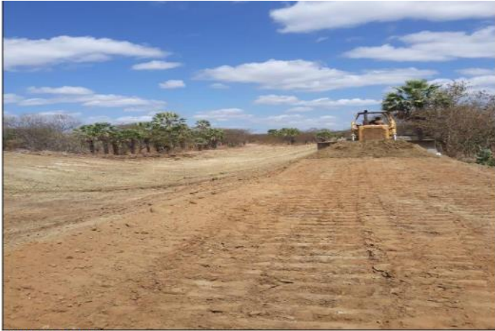
TRATOR DE ESTEIRA