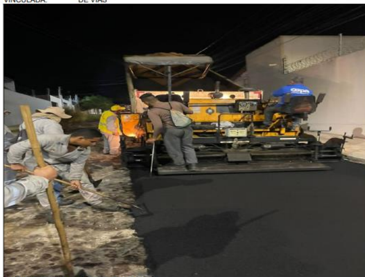
VIBROACABADORA - APLICAÇÃO DE CBUQ

CONTA VINCULADA: 1 - LOCAÇÃO DE EQUIPAMENTOS PARA A COORDENAÇÃO DE MANUTENÇÃO DE VIAS