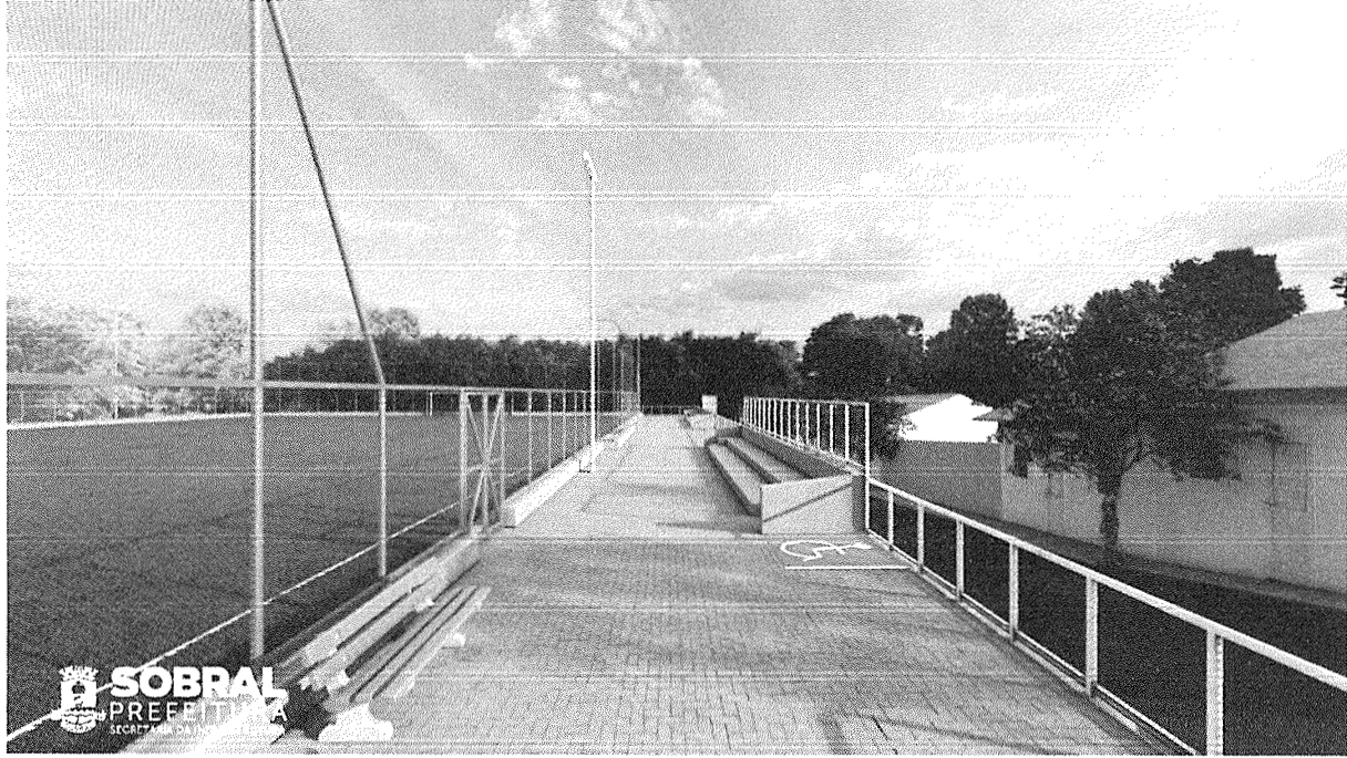
Fig. 4: Perspectiva eletrônica 02