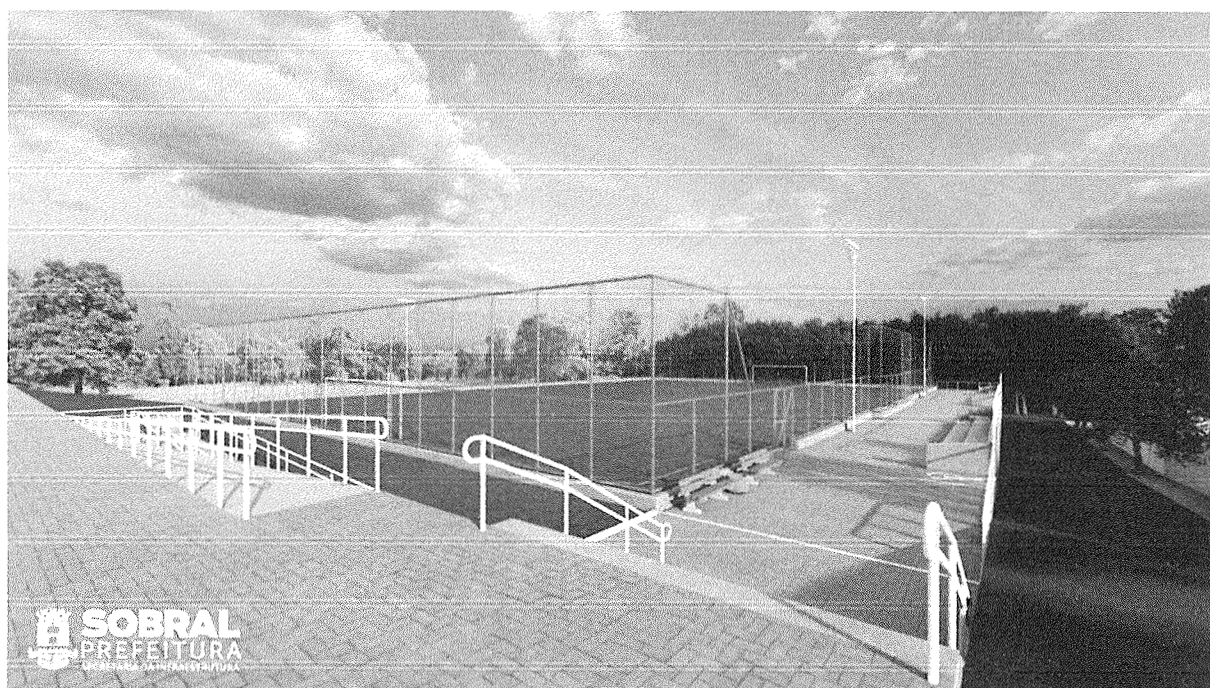
Fig.3: Perspectiva eletrônica 01

Outra importante premissa foi na escolha dos materiais indicados no campo e em seu entorno como: Grama sintética, alambrado, postes, pavimentação de contorno em intertravado onde priorizou-se a maior durabilidade, resistência, e baixo custo de manutenção.