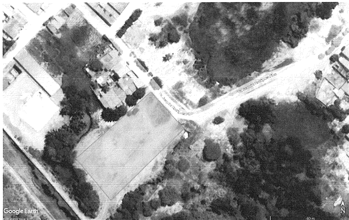
Fig.1: Localização José Euclides

A proposta de intervenção em questão está localizada na Tv. Joaquim Rodrigues Filho, bairro José Euclides, Sobral - CE. Nesse local encontra-se um terreno com desnível parcialmente acentuado em uma área que está sendo subutilizada.