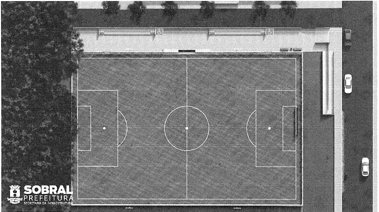
Fig.2: Implantação Campinho Dom Expedito

Com uma área total de intervenção de aproximadamente 5.012,80m 2 , o presente projeto trata da construção de um equipamento urbano com objetivo de integrar o uso da população e impulsionar as atividades recreativas, esporte e lazer no Bairro José Euclides.