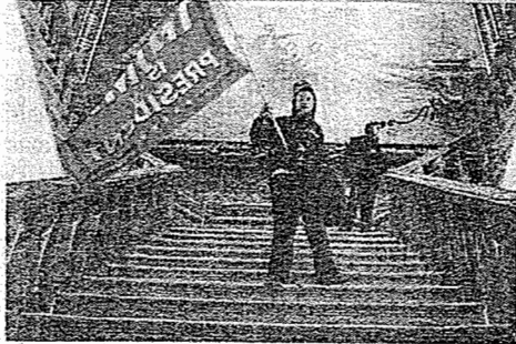
MANIFESTANTE segura uma bandeira Trump dentro do edifício do Capitólio

Havia de tudo naquela multidão: jovens, velhos, famílias, veteranos, pastores, policiais (alguns pastores policiais), professores e malucos fantasiados, todos movidos pela realidade paralela instigada pelo presidente Donald Trump.