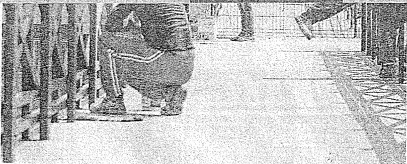
OBRAS do Polo Gastronômico da Sabiaguaba devem terminar este ano

"Como não tivemos o estudo arqueológico, não sabemos se o local tinha ou não um sítio