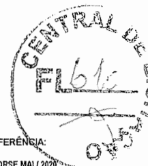
TABELA DE REFERÊNCIA: