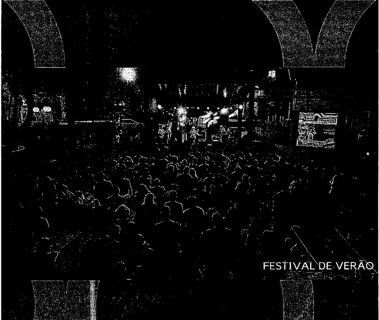
FESTIVAL DE VERÃO