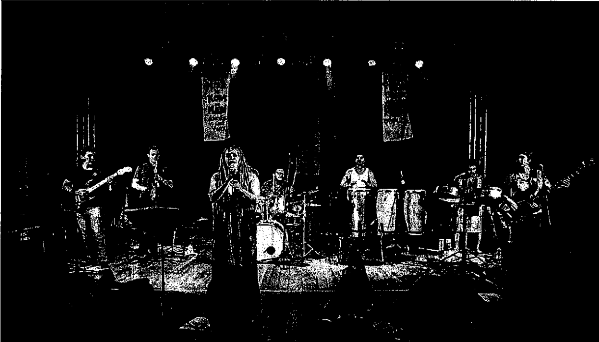
DRAGÃO DO MAR