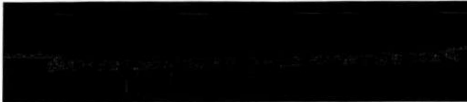
Seções tipo para vias locais, coletoras e arteriais de acordo com o projeto N-0005- DE-PA-IQA-020-R0

✓ Principal do Igarapé Quarenta, composto pelo Eixo-100 (margem direita do Igarapé Quarenta) e Eixo-200 (margem esquerda do Igarapé Quarenta), foi dada continuidade os serviços de terraplenagem para conformação das camadas de sub base e base do viário.