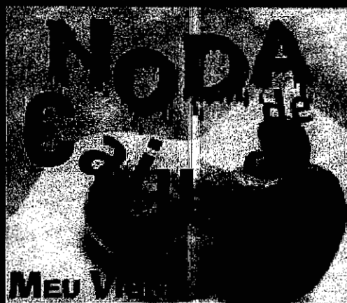
MEU VÍCIO VOL.02