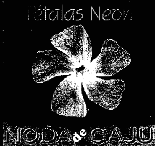
PÉTALAS NEON VOL.07