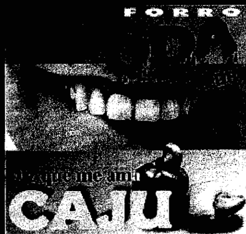
DIZ QUE ME AMA VOL.05