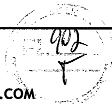
TABELA DE REFERÊNCIA:

SÃO JORGE CONSTRUÇÕES EIRELI RUA DEP. JOÃO ADEODATO, 550 - SALA 318A CENTRO - SOBRAL - CE - CEP: 62.010-450 CONTATO: IGOR LUCETTI / EMAIL: IGORLUCETTI@HOTMAIL.COM FONE: (88) 9 9216-2132 CNPJ: 04.929.389/0001-05