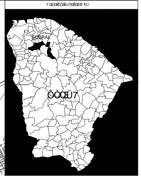
BAIRROS DA ZONA URBANA DE SOBRAL