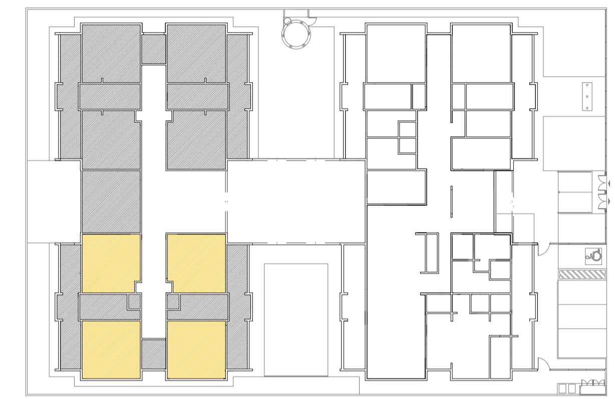
CROQUI DE REFERÊNCIA