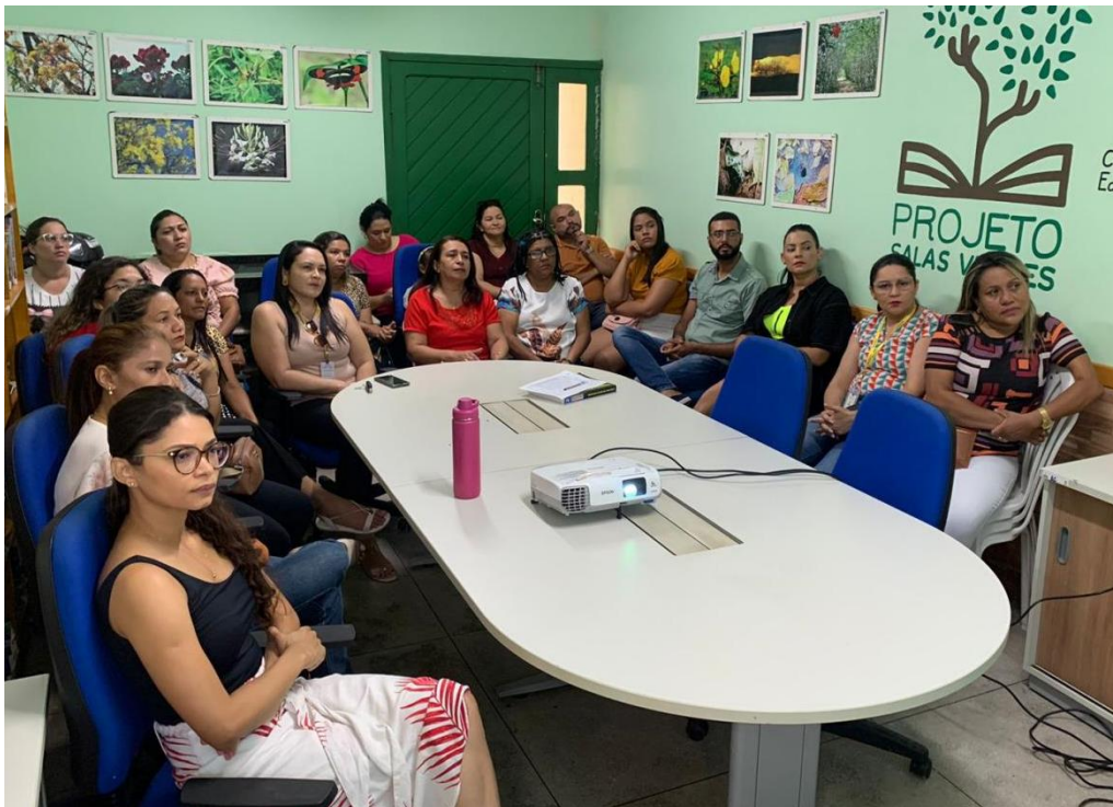
Figura 5: Momento com Professores da Escola Professora Maria das Graças Teixeira Pontes.