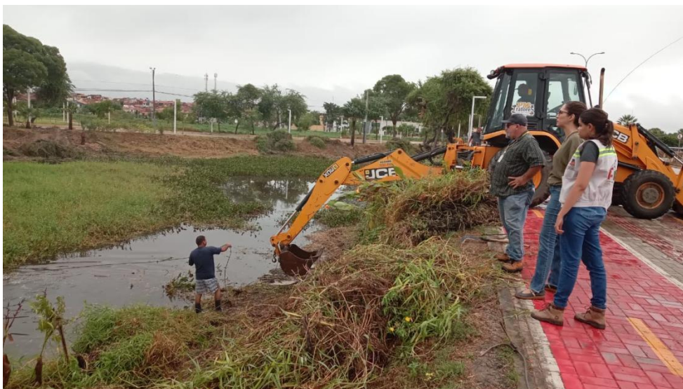
Figura 4: Limpeza Lagoa da Fazenda.