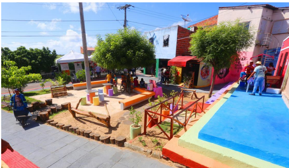
Figura 3: Parque Naturalizado na Travessa São Judas Tadeu, no Bairro Sumaré.