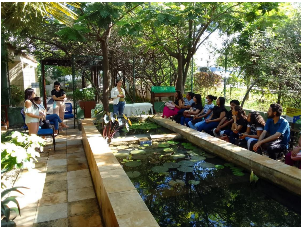
Figura 7: Visita ao Jardim Sensorial dos Alunos do Curso de Saneamento Ambiental do IFCE.

✓ Acompanhamento de 120 visitas no Jardim Sensorial da AMA, recebendo um público de 1.752 pessoas;