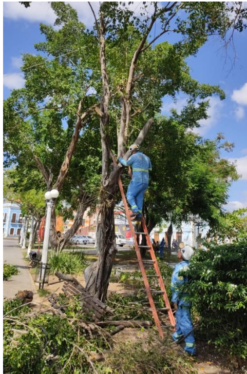
Figura 2: Poda na Praça São João.