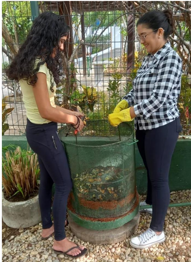
Figura 8: Manejo da composteira