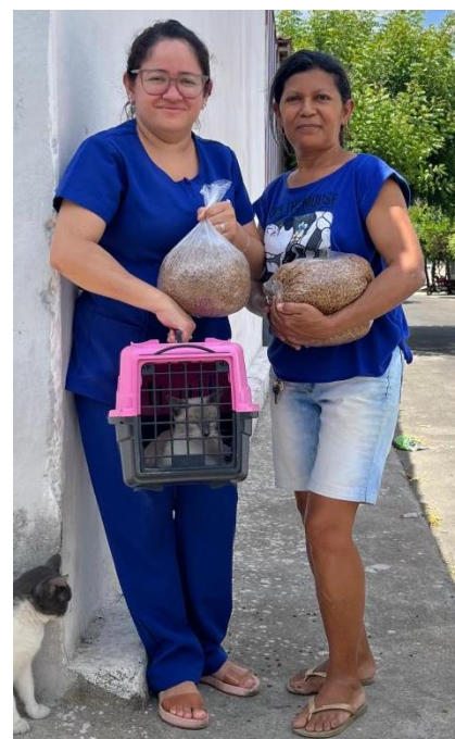
Figura 10: Coleta de animais para cuidados médicos.

✓ Campanha de Doação de Animais que foi retirado da rua pelo Projeto Lar, com as seguintes quantidades: