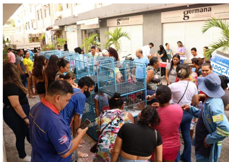
Figura 11: Campanha de Adoção de Animais.