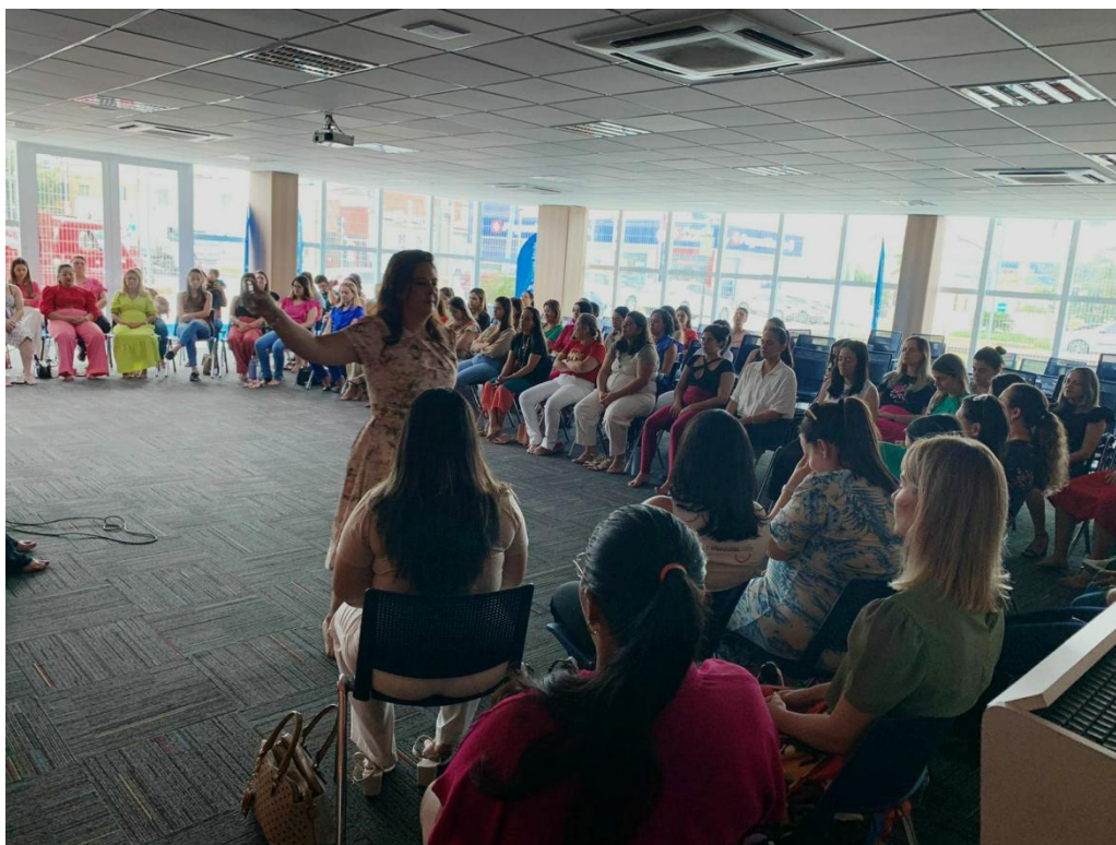
Figura 6: Palestra Aromoterapia, com mães dos alunos do Colégio Luciano Feijão.