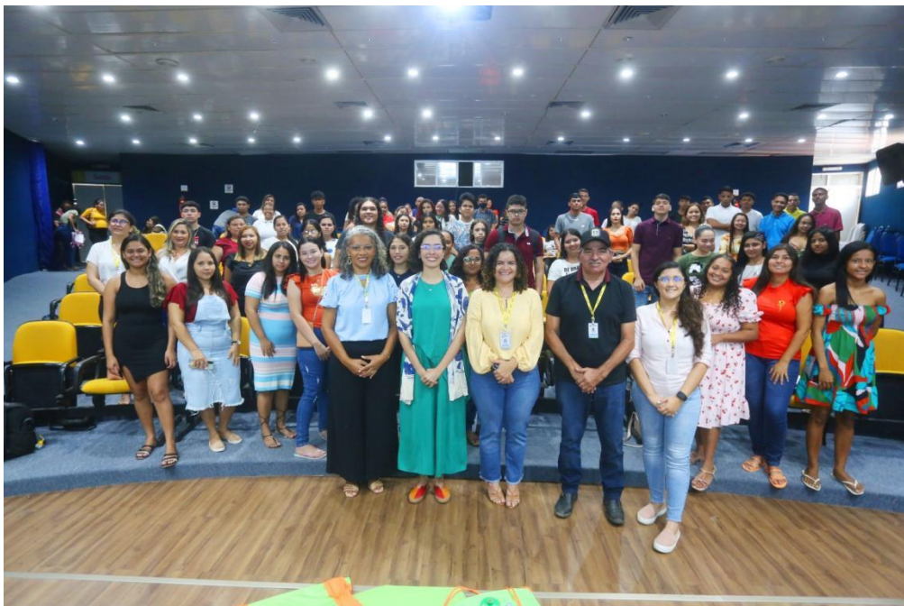
Figura 9: Recepção dos EJAS 2023.