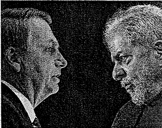
FALTA de fôlego da terceira via deixa eleição presidencial polarizada