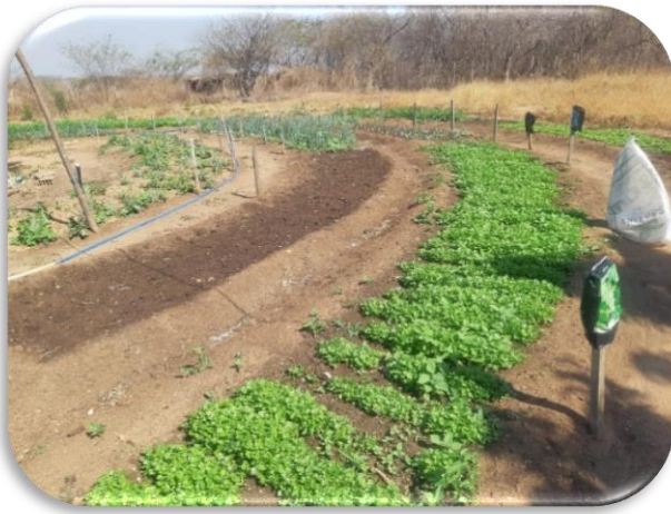
- Implantação de 05 (cinco) mandalas.

- Cadastramento e início de preparo de áreas do Projeto de revitalização da cultura do Algodão, com 21 (vinte e um) produtores cadastrados com uma área de 22 (vinte e dois) hectares.