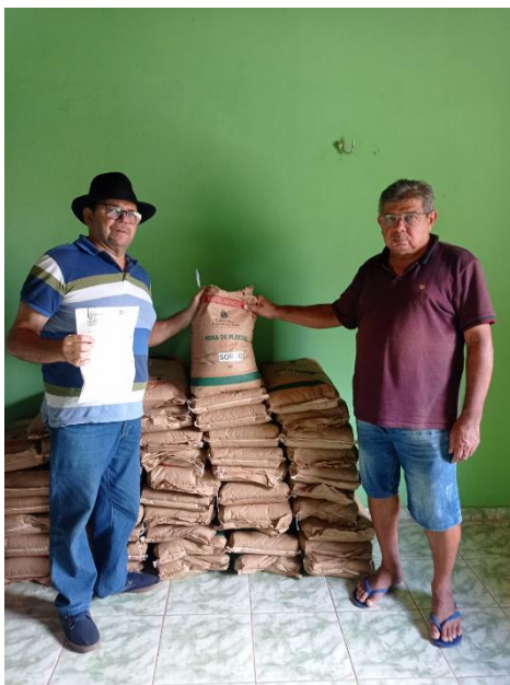
Distribuição de sementes e mudas de palma forrageira do programa Hora de Plantar para 540 (quinhentos e quarenta) famílias;