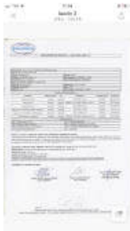
WhatsApp Image 2024-12-11 at 12.01.08 (1).jpeg 172K