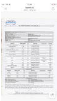
WhatsApp Image 2024-12-11 at 12.01.07.jpeg 190K