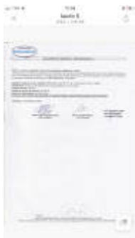
WhatsApp Image 2024-12-11 at 12.01.08.jpeg 106K