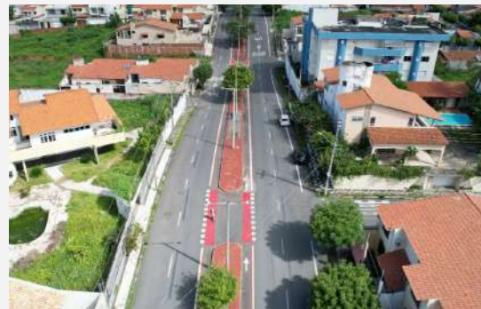
Foto: Trecho de ciclofaixa nas ruas Maria Alice Barreto Lima e Júlio Ribeiro Dias, Campo dos Velhos.