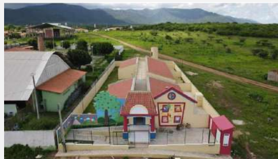
Foto: CEI Margarida Abreu no distrito de Jaibaras