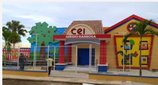
Foto: CEI Sergio Barbosa no bairro Derby