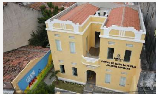
Foto: Centro de Saúde da Família Jurandir Carvalho