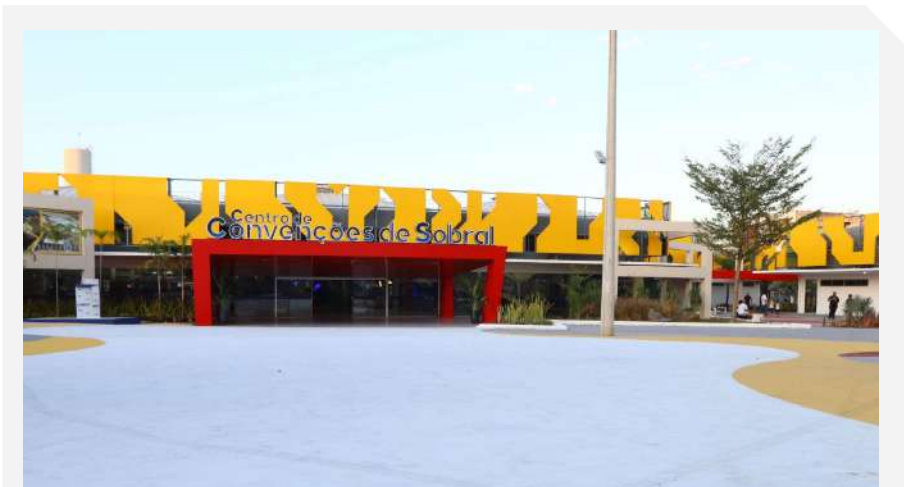
Foto: Av. Dr. José Arimathéa Monte e Silva, 300 - Junco, Sobral