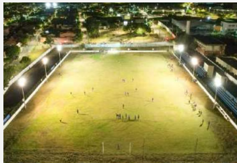
Foto: Mini Estádio Eder Venâncio