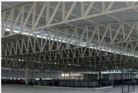
Foto: 2º Pavimento do Mercado Público