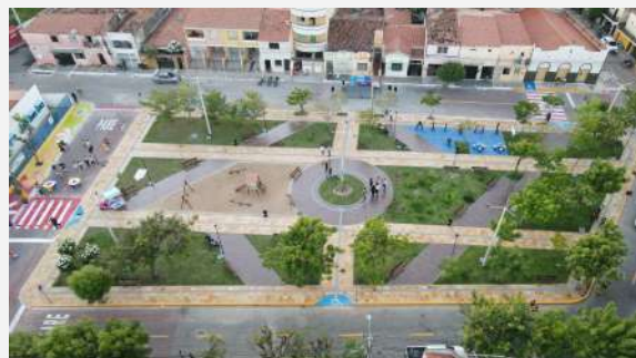
Foto: Praça José Euclides Ferreira Gomes, Pedrinhas