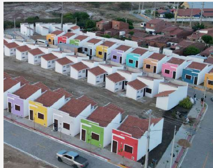
Foto: Unidades Habitacionais no Padre Palhano

E foram emitidos 232 termos de cessão de posse para regularização fundiária dos moradores do bairro Dom José.