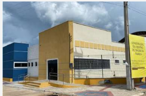
Foto: Centro de Saúde no distrito São José do Torto