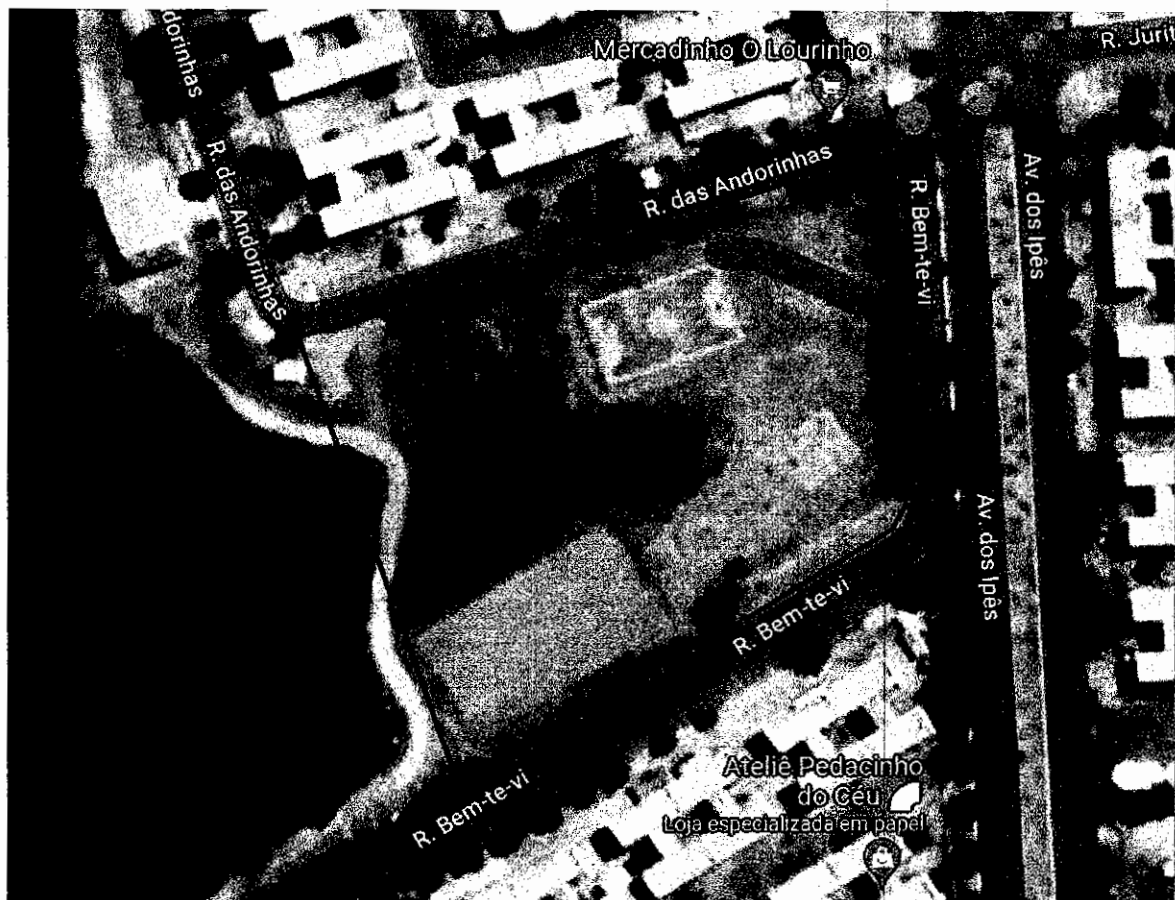
Fig.1: Localização Praça

A área em questão está localizada no Residencial Nova Caiçara, na cidade de Sobral-CE. Delimitada pela Rua Bem-Te-Vi e Rua das Andorinhas, as condições atuais de infraestrutura encontra-se visivelmente desgastada não permitindo o pleno aproveitamento do seu potencial urbano.