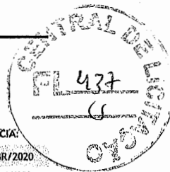
TABELA DE REFERÊNCIA: