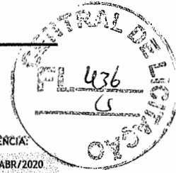
TABELA DE REFERÊNCIA: