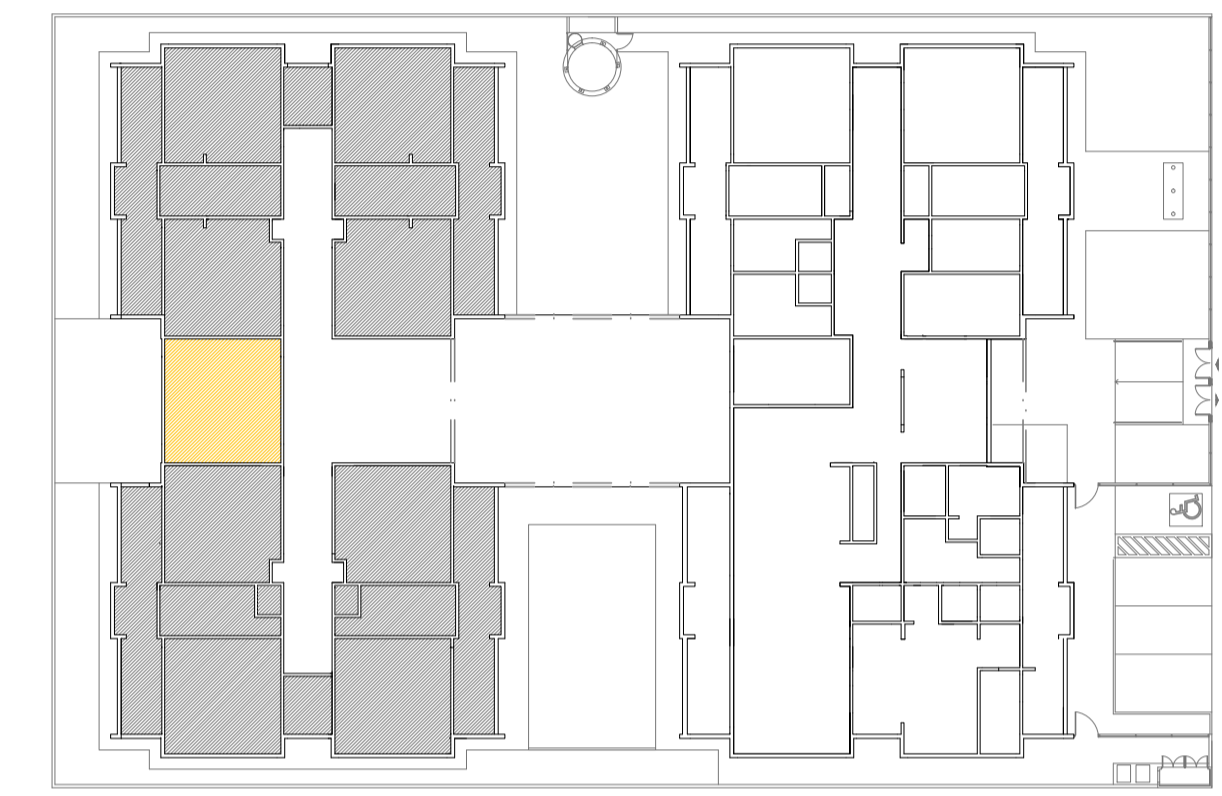
CROQUI DE REFERÊNCIA