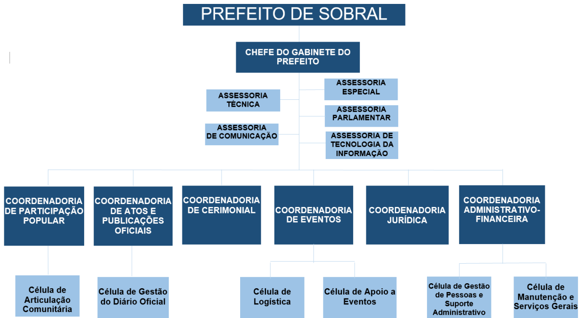
Figura 1: Organograma do GABPREF, de acordo com o artigo 3º do Decreto Nº 2166, de 11 de janeiro de 2019..... 4