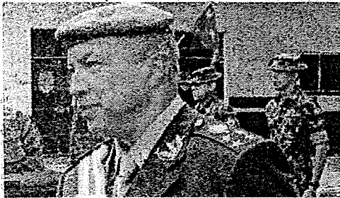
GENERAL Júlio Cesar Arruda, comandante do Exército exonerado