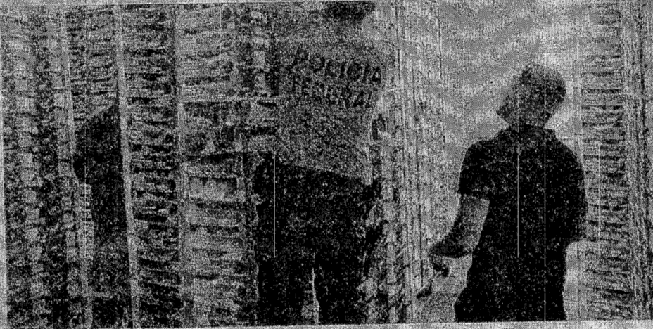
Polícia Federal apreendeu 1,38 tonelada de cocaína escondida em carregamento de manga no Porto de Natal

Rio Grande do Norte tem se destacado na fruticultura, inclusive superando o Ceará como líder nacional na exportação de melão, mas esse protagonismo, motivo de orgulho para o Estado vizinho, também gera preocupações de Segurança e já virou caso de Polícia.