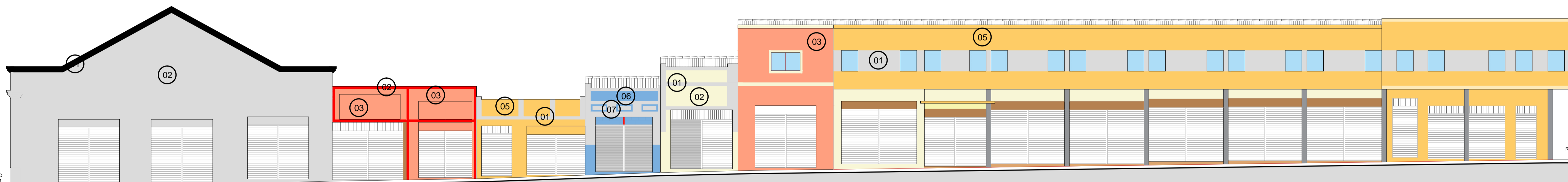
01 PINTURA FACHADA 01 1/100