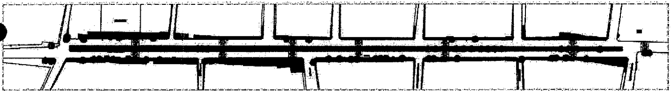
Fig.2: Planta de Construção proposta

Com uma área total de intervenção de 12.601,70m 2 , o presente projeto trata da construção de um canteiro central e dos passeios do seu entorno, no distrito de Rafael Arruda, em Sobral - CE e tem como objetivo, não só a requalificação do espaço em questão, como também a melhoria do seu entorno imediato de forma a reintegrar com os demais espaços públicos do território municipal e impulsionar os usos e atividades de lazer no local