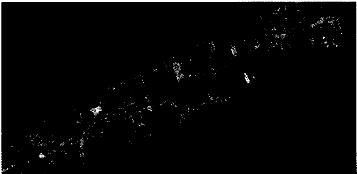
Fig. 3: Planta Existente