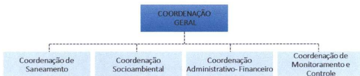
FIGURA Nº 02 – ORGANOGRAMA DA UGP

Fonte: Sobral, Decreto Nº 2101, de 17 de agosto de 2018