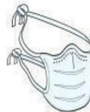
Máscara Cirúrgica (paciente durante o transporte)