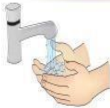
Higienização das mãos