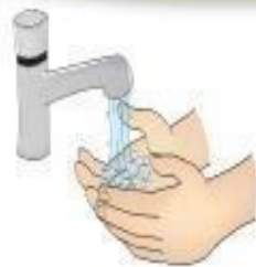
Higienização das mãos