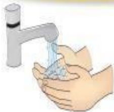
Higienização das mãos