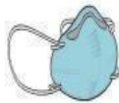
Máscara PFF2 (N-95) (profissional)