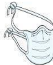
Máscara Cirúrgica (paciente durante o transporte)