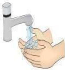
Higienização das mãos

Devem ser seguidas para TODOS OS PACIENTES , independente da suspeita ou não de infecções.