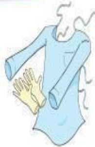
Luvas e Avental