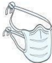
Máscara Cirúrgica (profissional)