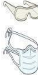
Óculos e Máscara