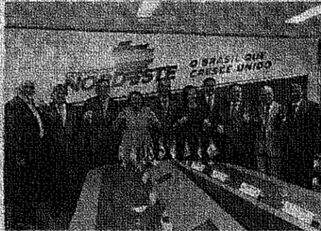
GOVERNADORES do Nordeste têm divergência de concepção com governo Bolsonaro