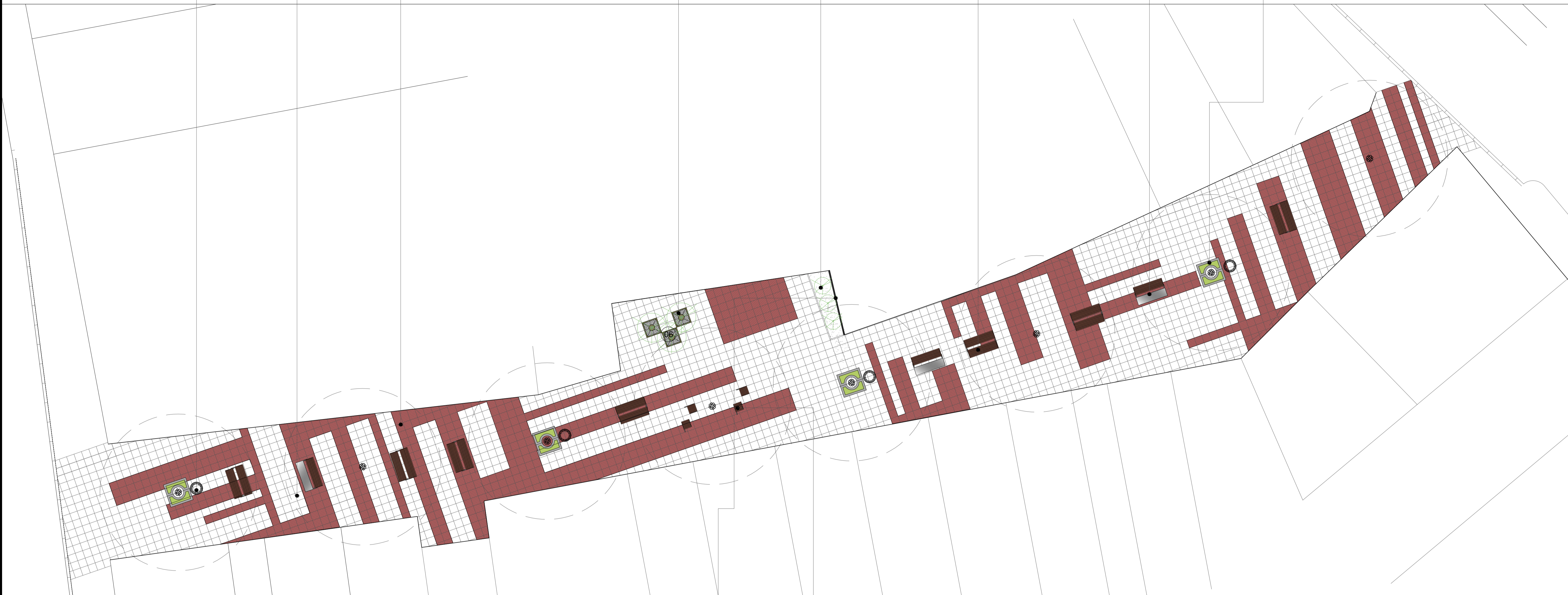
01 PLANTA BAIXA LAYOUT 1/100