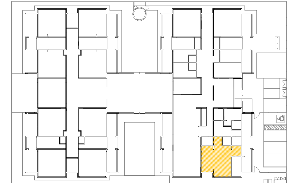
CROQUI DE REFERÊNCIA